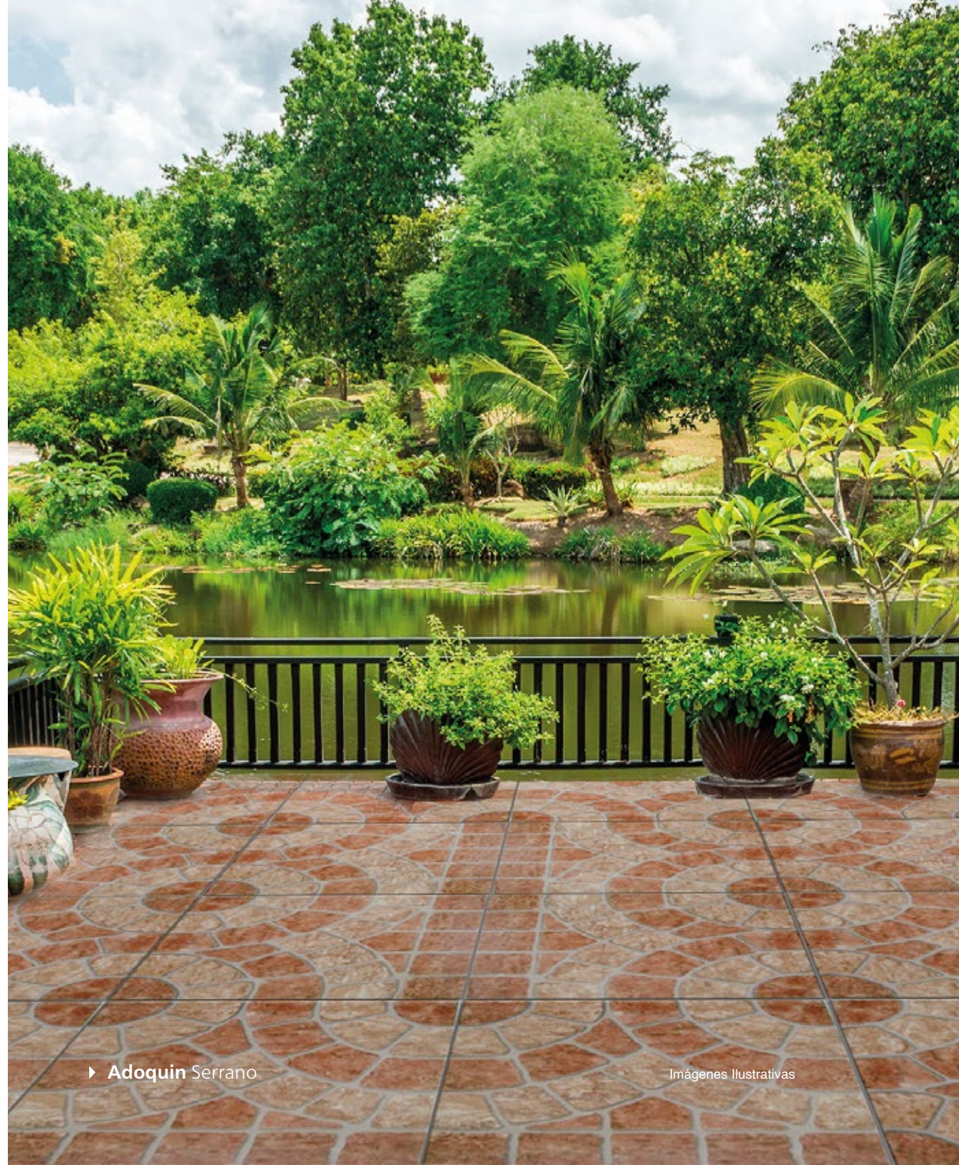
► Adoquin Serrano