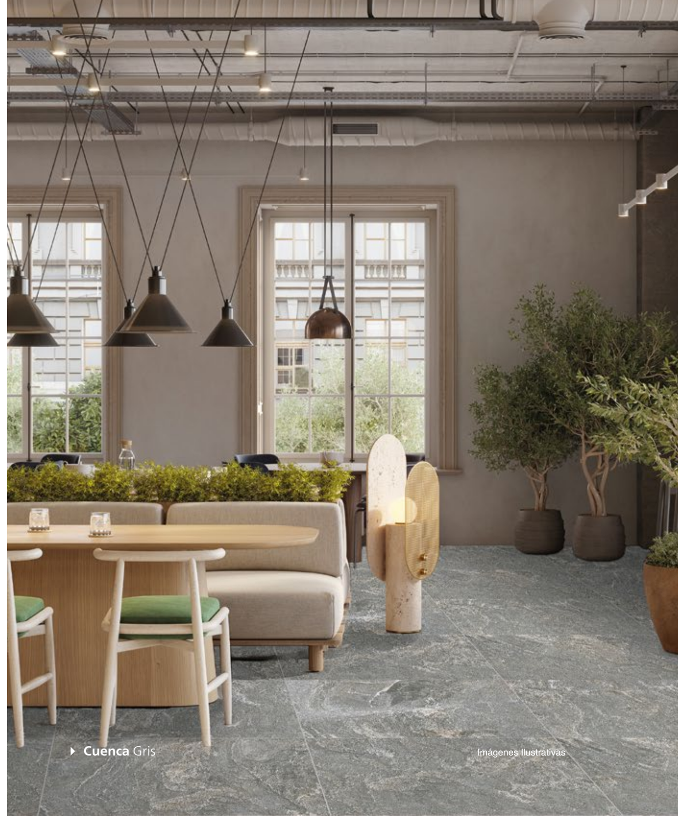
► Cuenca Gris