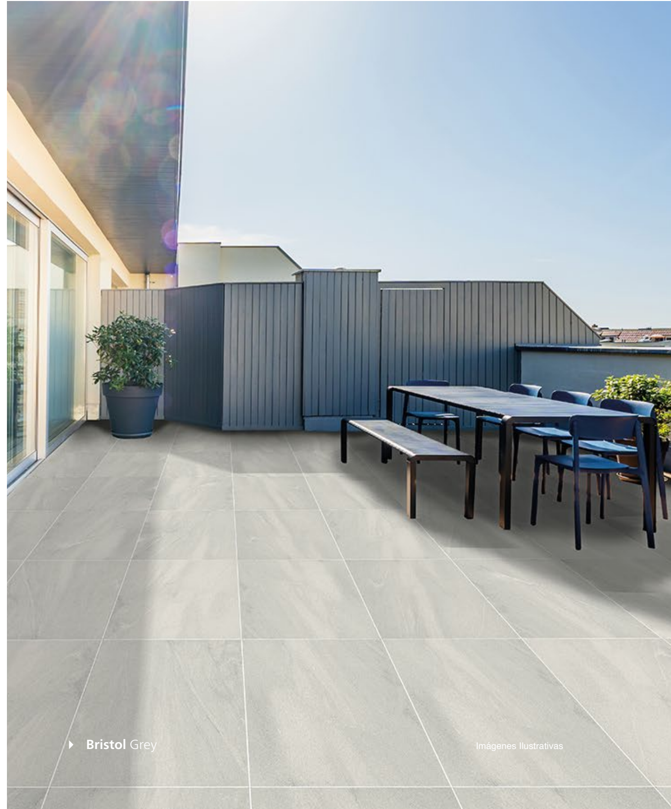
► Bristol Grey