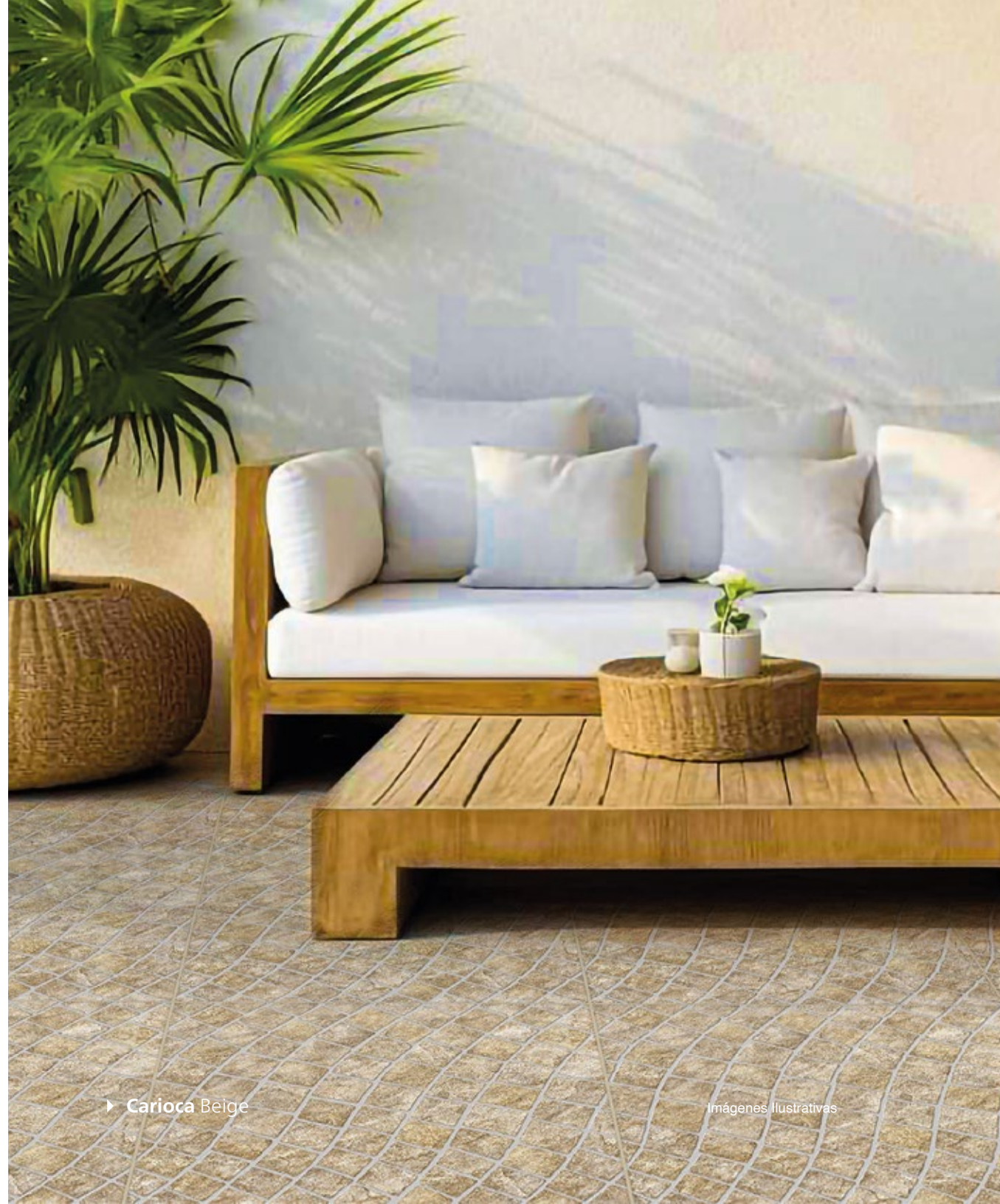
► Carioca Beige