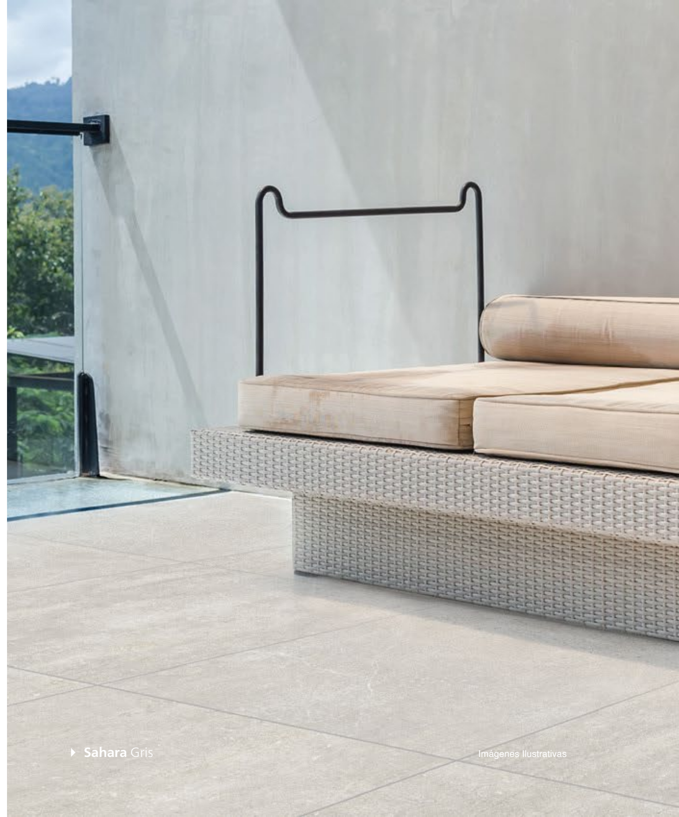
► Sahara Gris