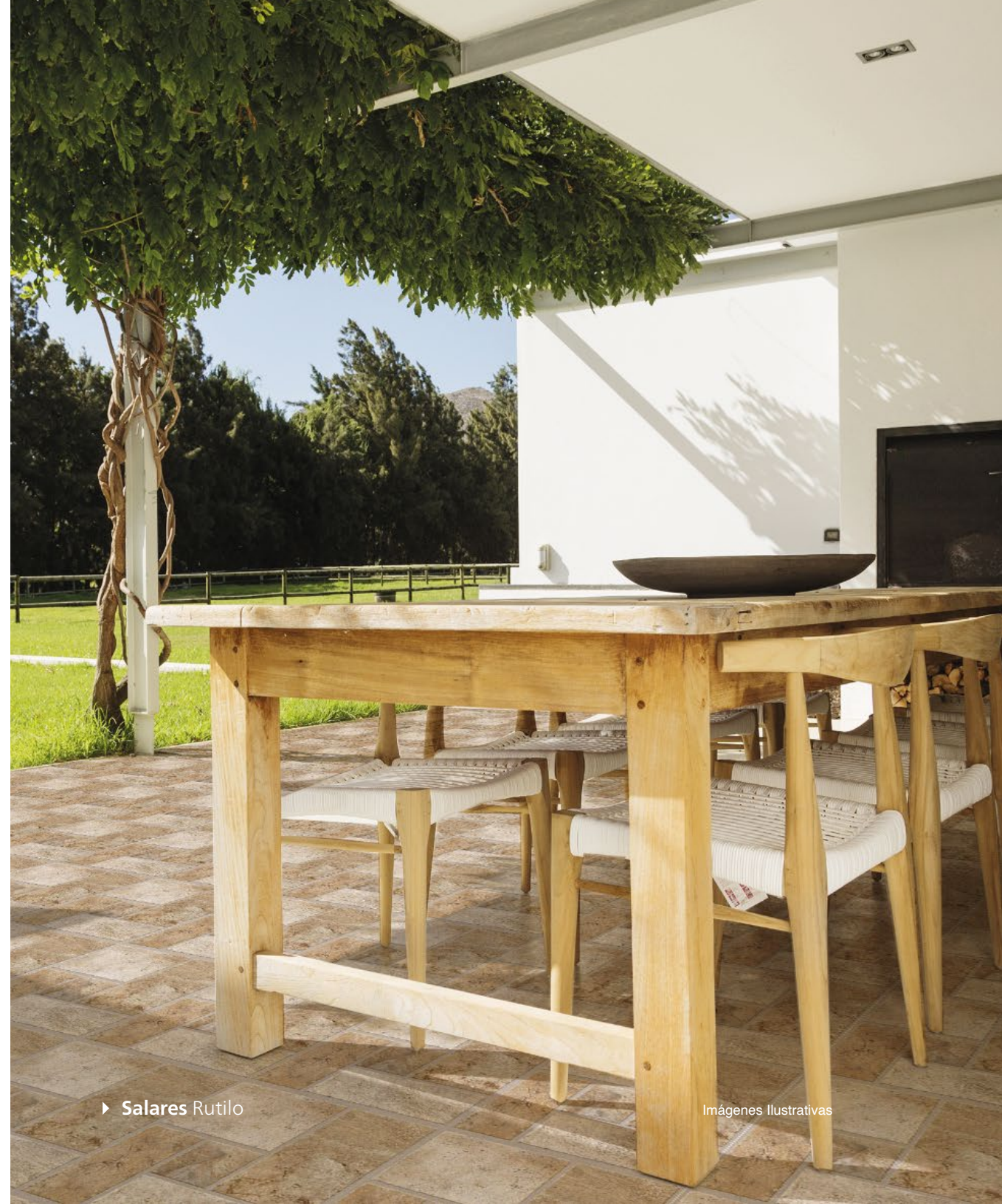
► Salares Rutilo