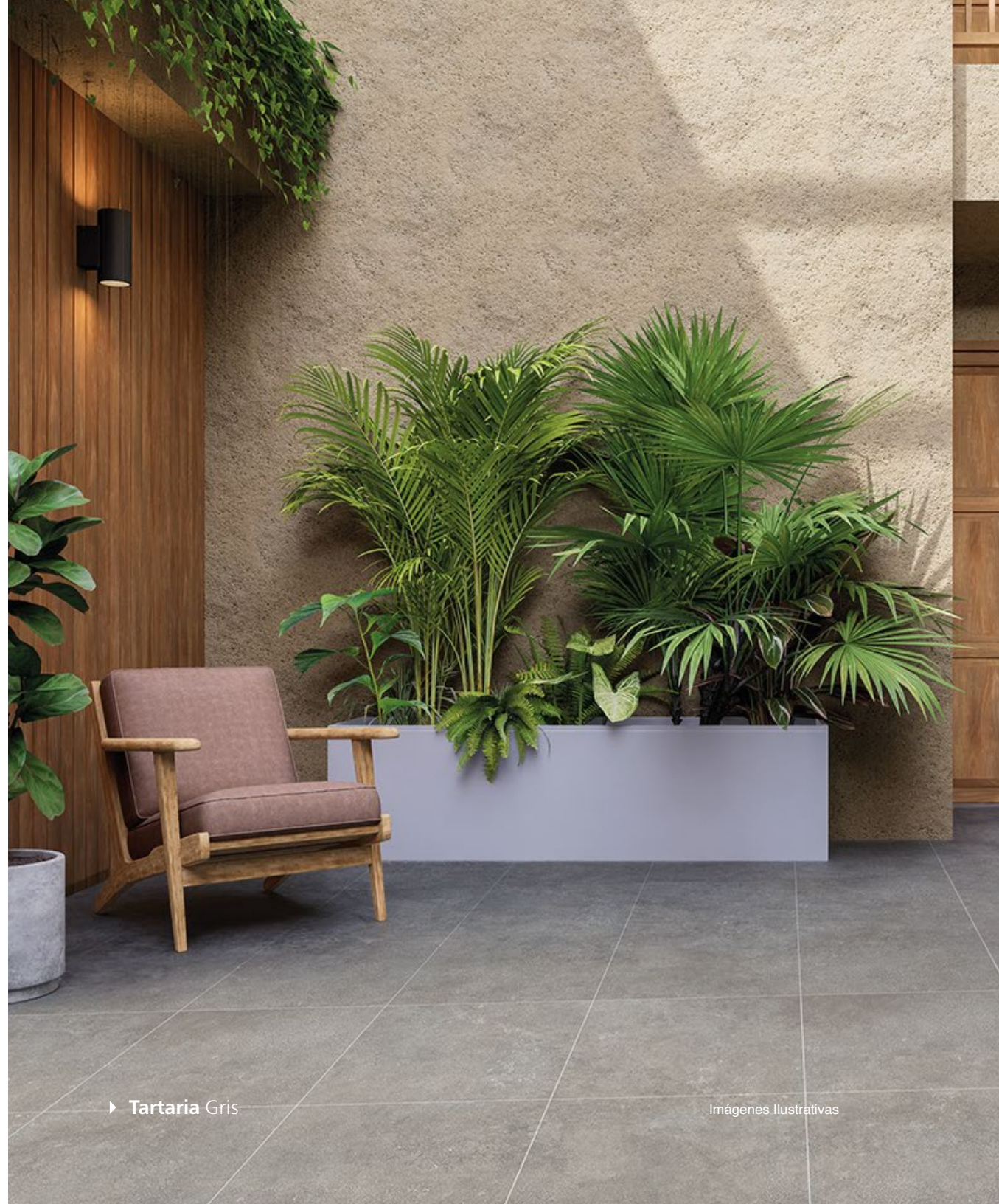
► Tartaria Gris