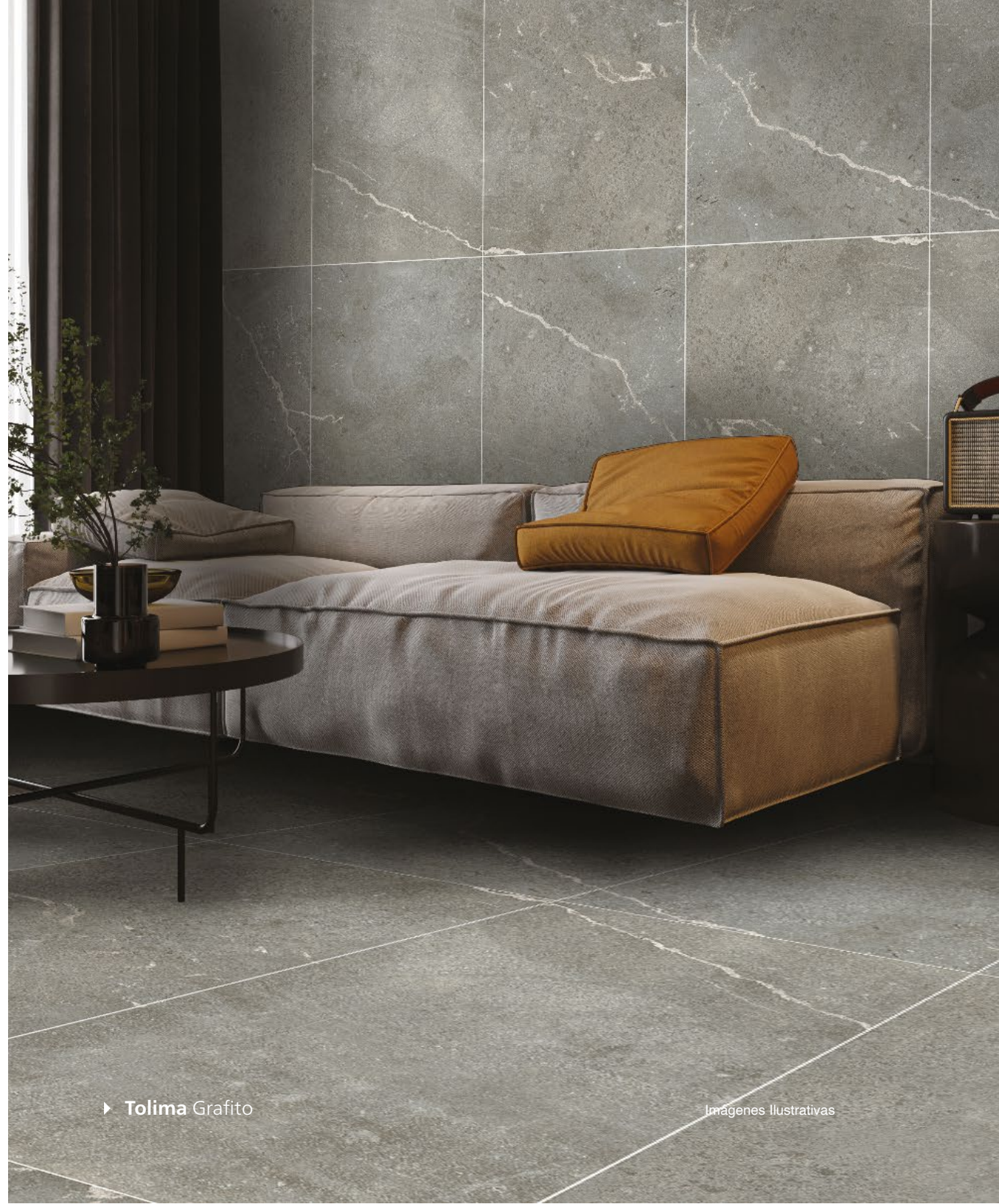
► Tolima Grafito