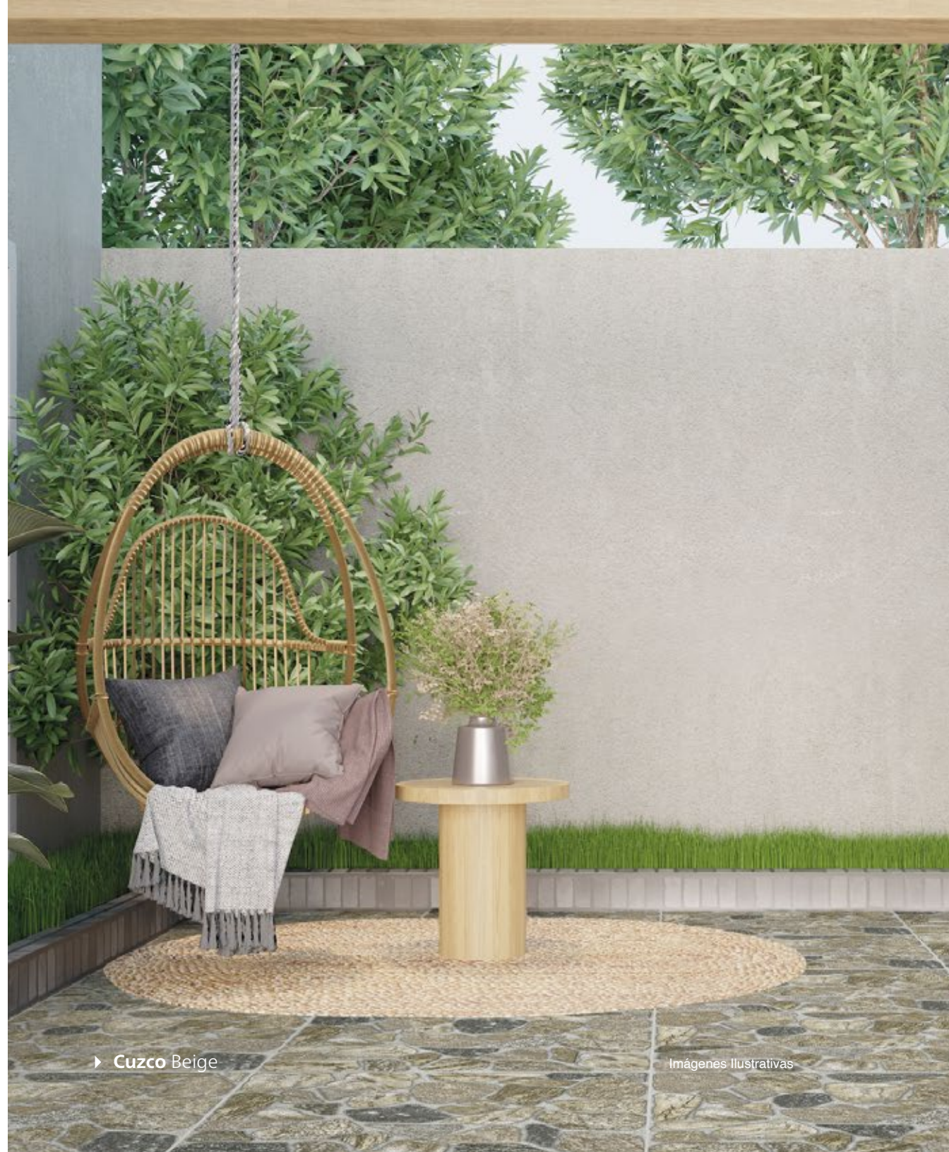
► Cuzco Beige