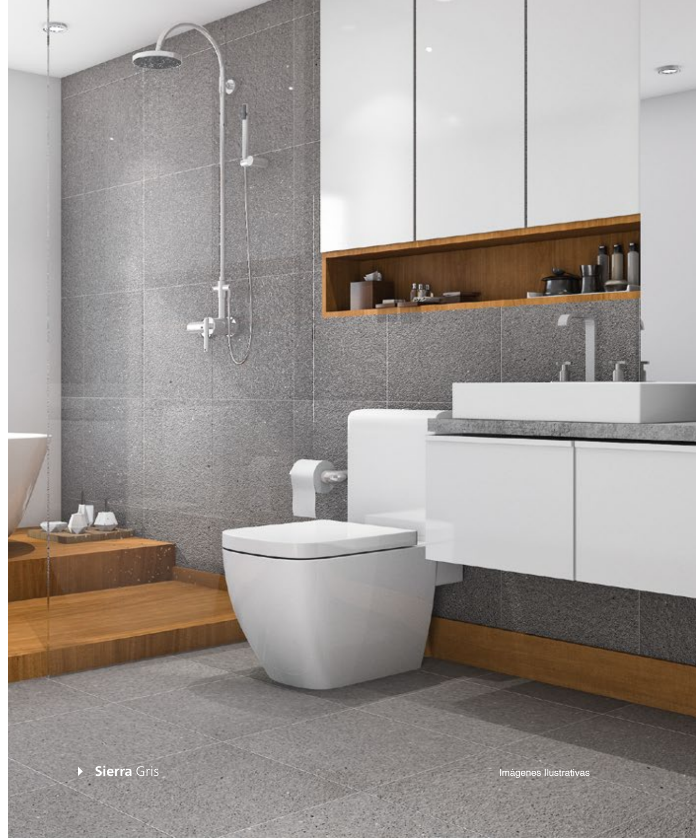
► Sierra Gris