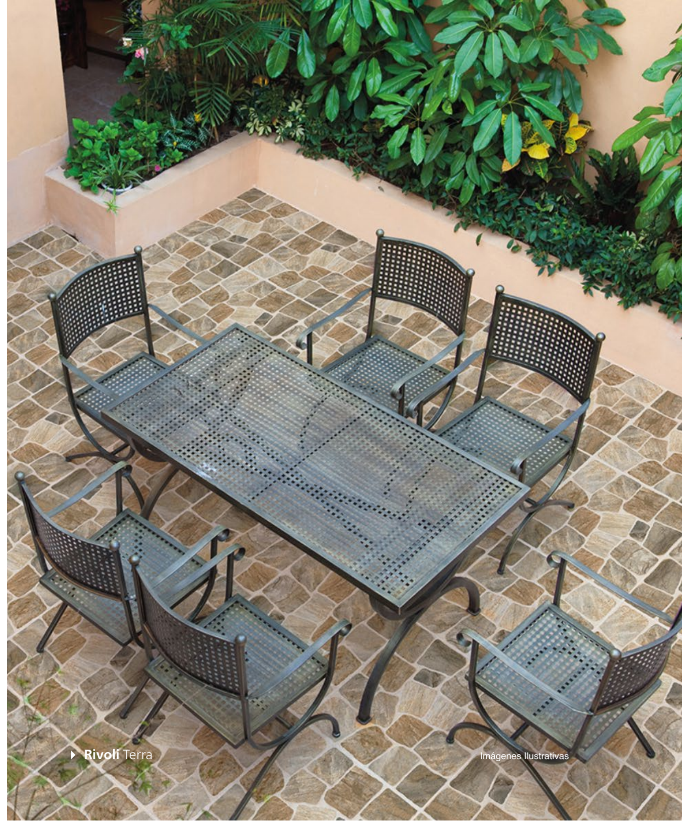
► Rivoli Terra