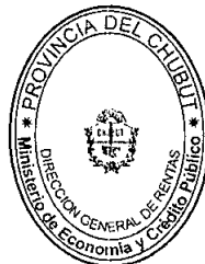
Cra. ANA ISABEL KRESTEFF DIRECTORA GENERAL Dirección General de Rentas Provincia del Chubut