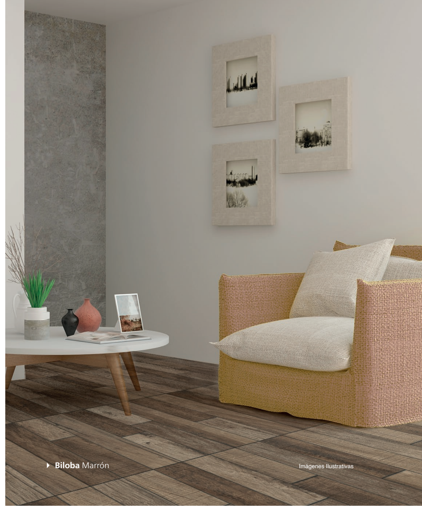
► Biloba Marrón