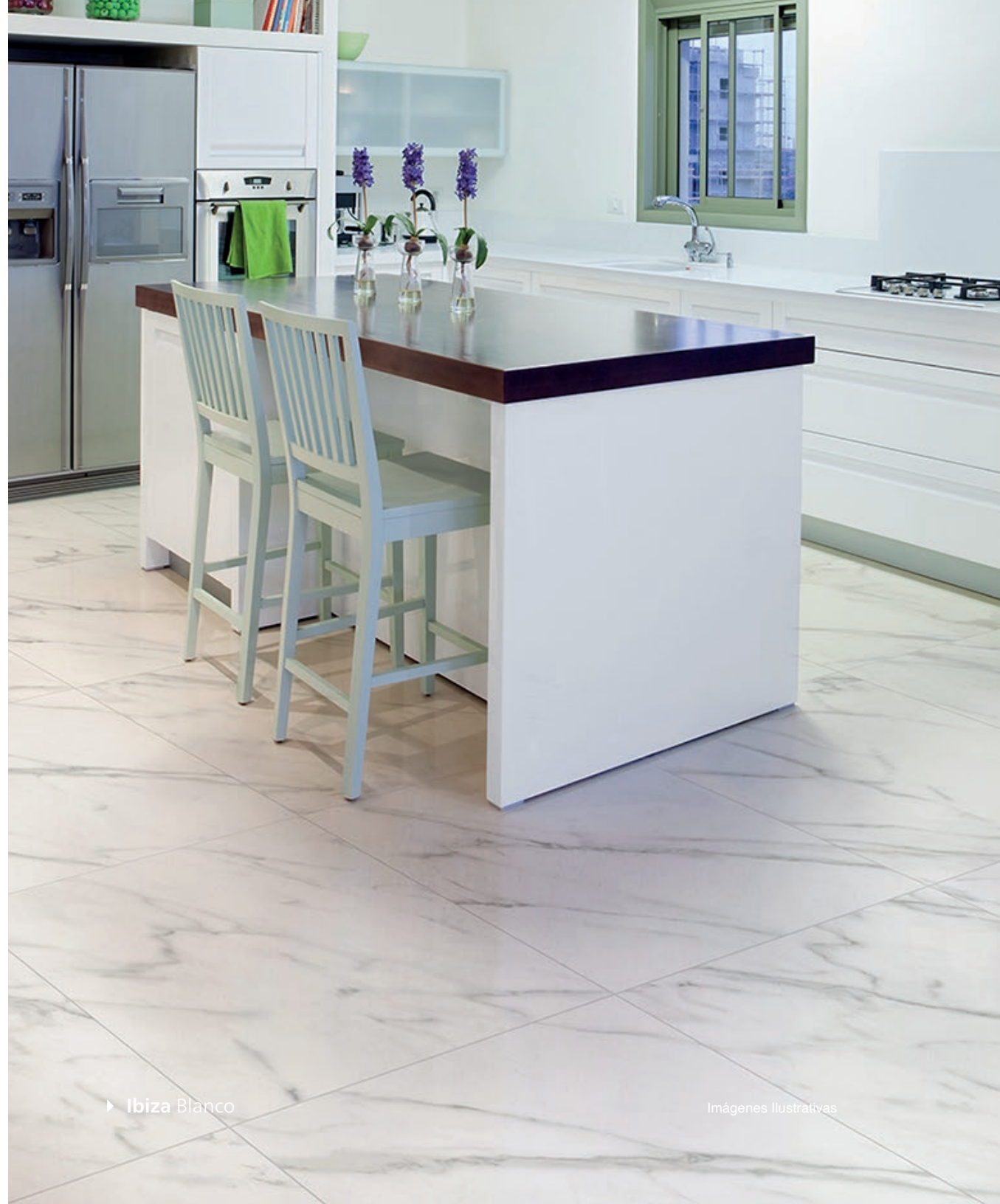
► Ibiza Blanco