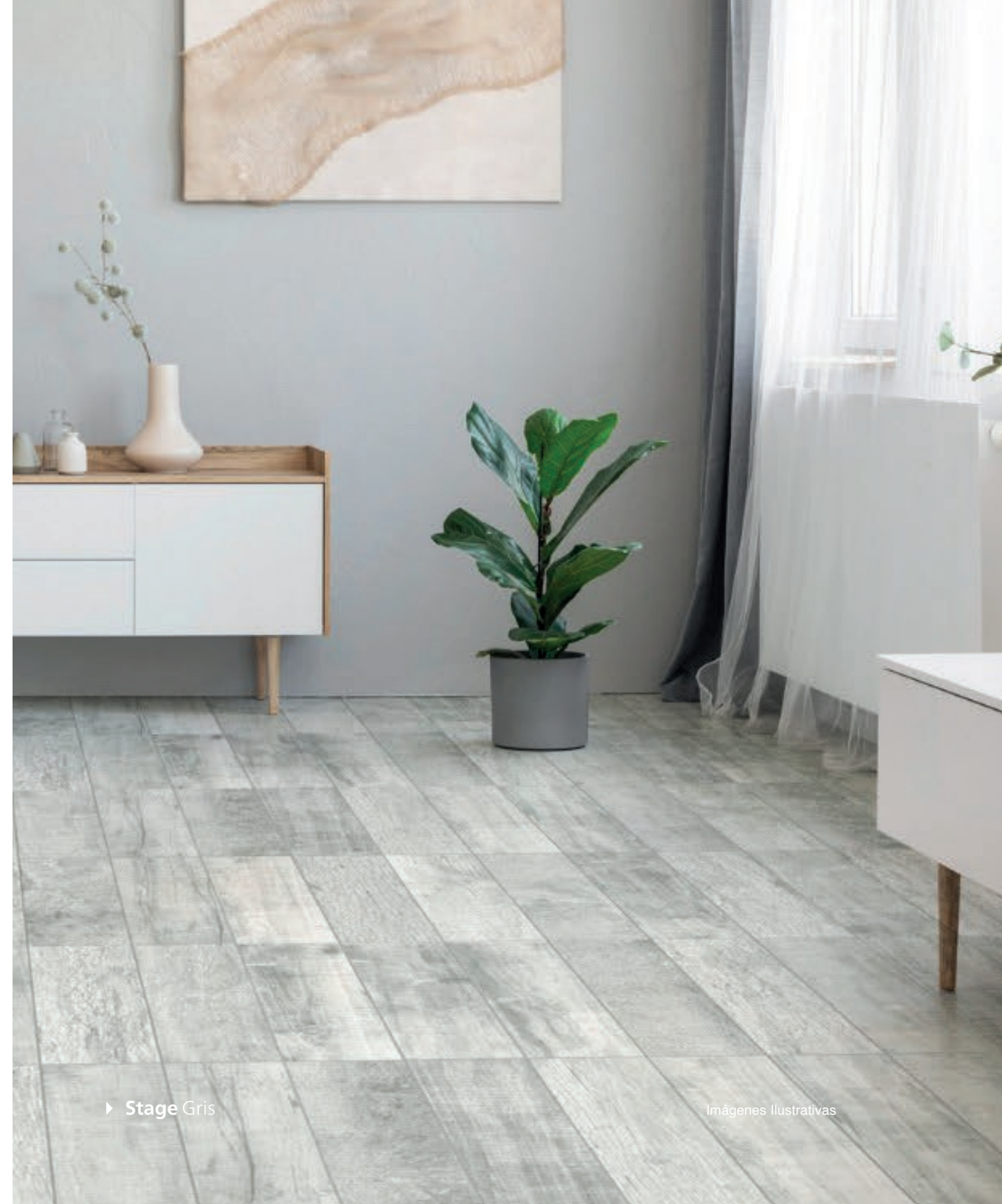
► Stage Gris