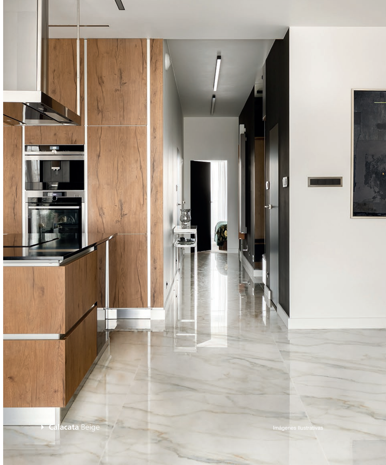
► Calacata Beige