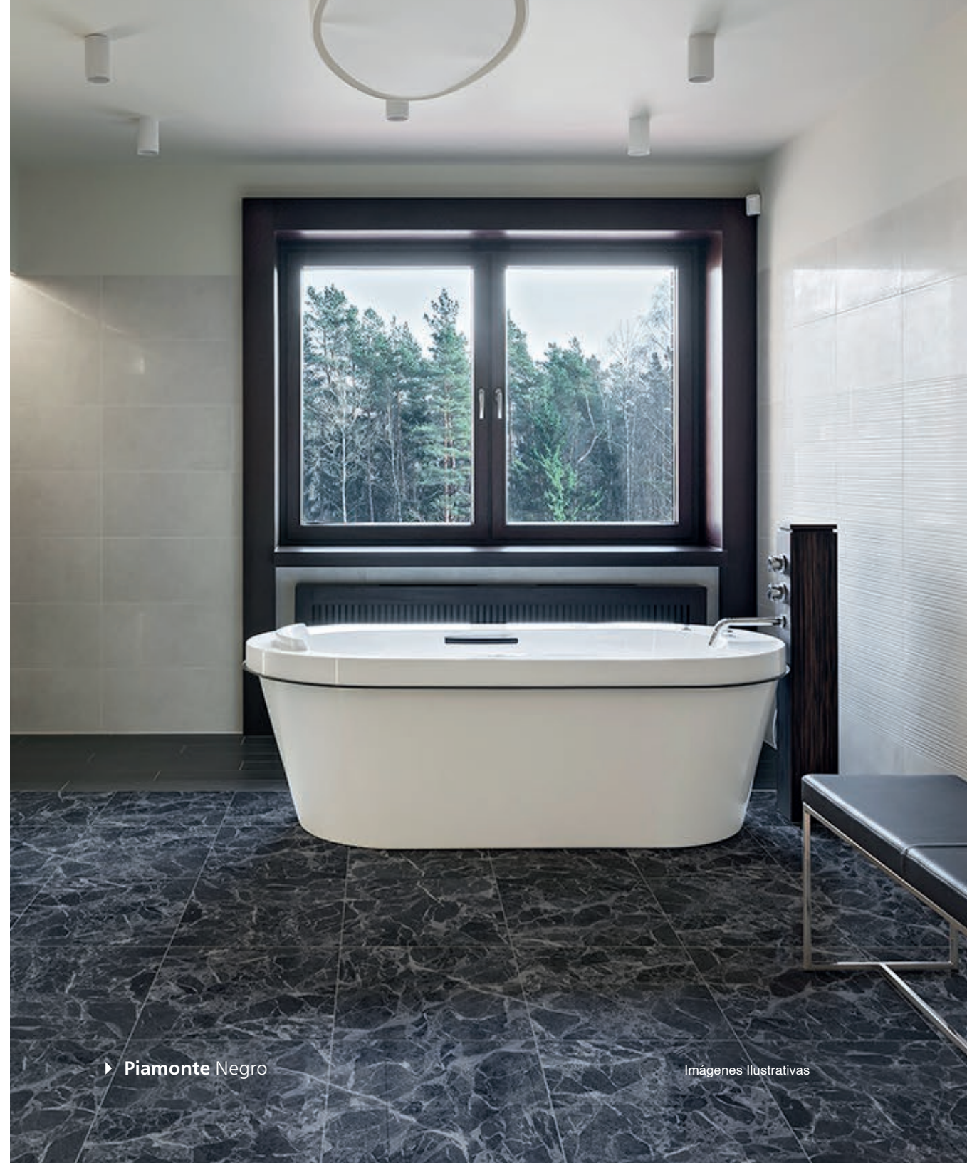
► Piamonte Negro