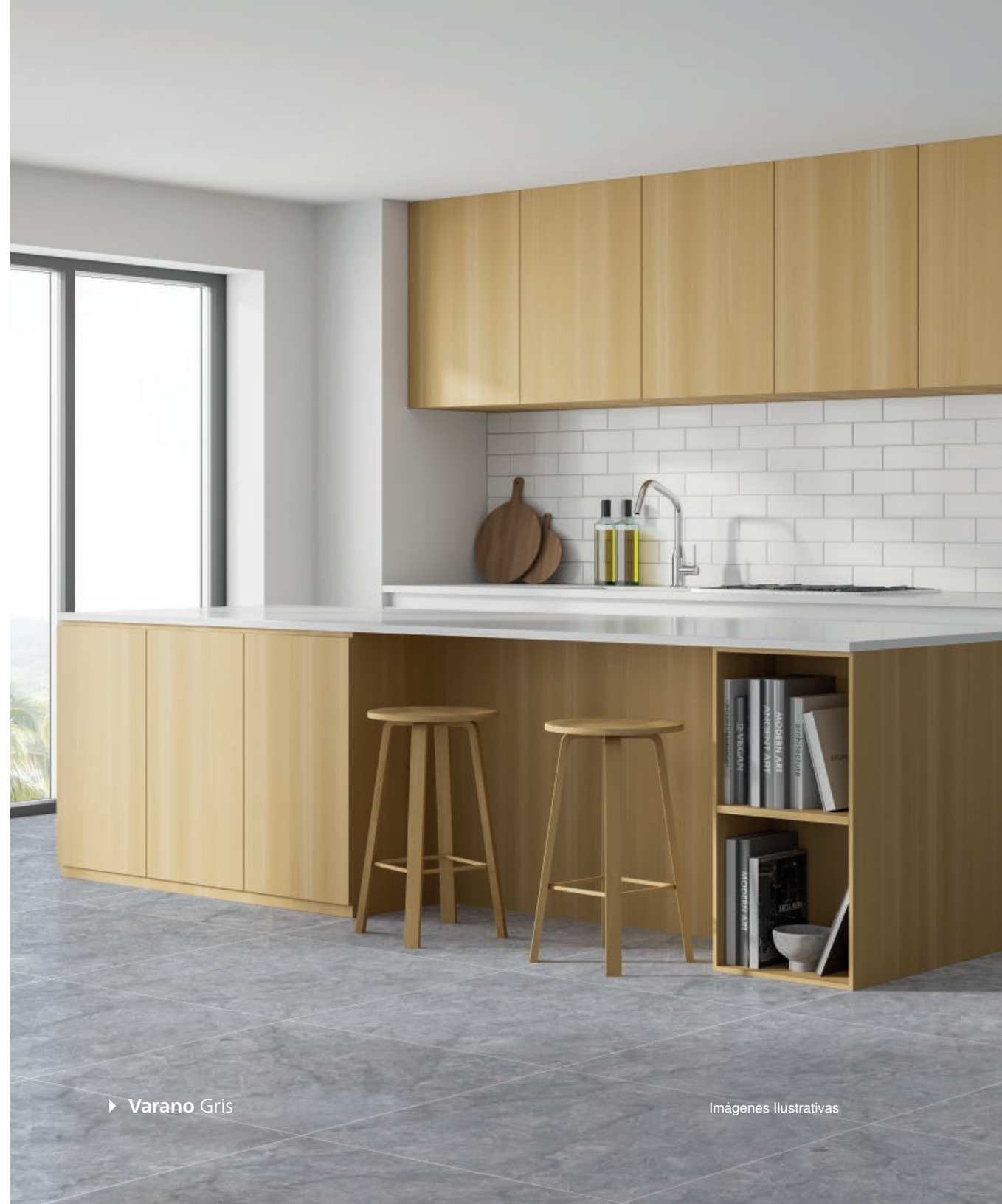
► Varano Gris